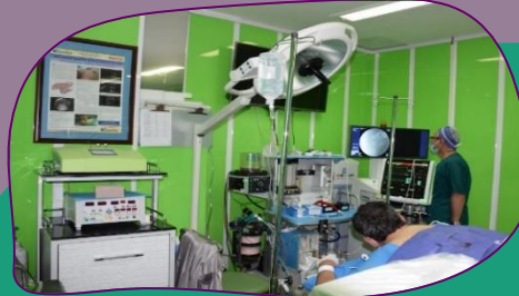
بخش طب تسکینی و درد

راه اندازی بخش طب تسکینی و درد در این مرکز برای کنترل و درمان درد به عنوان درد اولیه و پیشگیری و درمان درد مرکزی، صورت گرفته است.