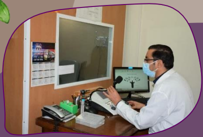
درمانگاه بیمارستان امام رضا(ع) تبریز