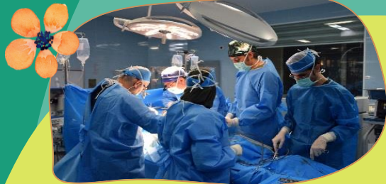
پیوند کبد و پانکراس

در این مرکز پیوند کبد زنده به زنده و پیوند پانکراس صورت می گیرد.