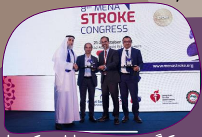
هشتمین کنگره مدیریت بیماران سکته حاد مغزی

این مرکز در دو سال اخیر موفق به افض گواهینامه درجه یک اعتباربخشی کشوری با بالاترین نمره در سطح مراکز آموزشی و درمانی وابسته به دانشگاه علوم پزشکی تبریز شده است. همچنین این مرکز در هشتمین کنگره مدیریت بیماران سکته حاد مغزی در منطقه مدیترانه، جایزه دریافت کرده است.