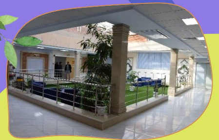
مرکز ید درمانی بیمارستان امام رضا(ع) تبریز

از جدید ترین قسمت های این مرکز، واحد ید درمانی برای از بین بردن سلو های سرطانی تیروئید می باشد.