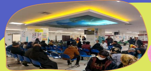
درمانگاه بیمارستان امام رضا(ع) تبریز