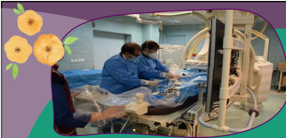
رادیولوژی مداخله ای

راه اندازی بخش طب تسکینی و درد در این مرکز برای کنترل و درمان درد به عنوان درد اولیه و پیشگیری و درمان درد مرکزی، صورت گرفته است.