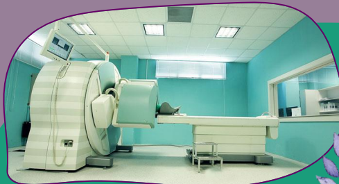
پزشکی هسته ای

روش های تشخیصی و درمانی نوین در پزشکی هسته ای برای درمان متاستازها، و تشفیص زودهنگام تومور، اختراق میان تومورهای فوش فیم و بدفیم، تعیین میزان پیشروی بیماری، تشفیص عود مجدد پس از درمان و ارزیابی پاسخ به درمان و طراحی درمان در این مرکز به کار گرفته می شود.