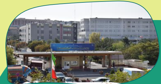
بیمارستان امام رضا(ع) تبریز