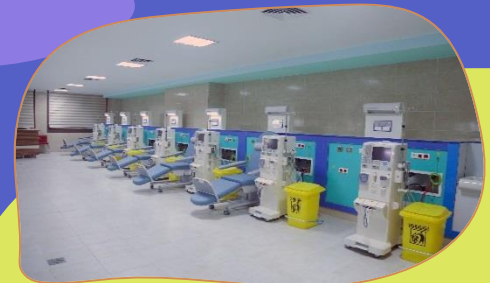
مرکز دیالیز بیمارستان امام رضا(ع) تبریز

این مرکز دارای بزرگ ترین مرکز دیالیز در فاورمیانه و بزرگ ترین مرکز پیوند اعضا در ایران می باشد.