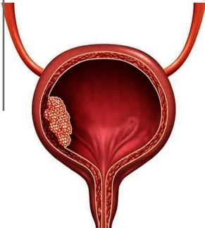
عوامل موثر در ابتلا به سرطان مثانه

طبیعی است انجام جراحی مثانه همانند دیگر جراحی ها با عوارضی همچون: خونریزی، بی اختیاری ادراری، ایجاد سنگ ادراری در کیسه جمع کننده ادراری حساسیت به داروهای بیهوشی، تنگی مجرای ادراری عفونت محل عمل، مشکلات جنسی (همچون ناتوانی در رسیدن به ارگاسم) و ایجاد لخته خون همراه باشد