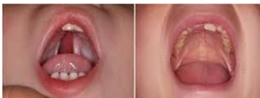
شکاف کام قبل از جراحی اولیه

این افراد معمولاً نیاز به درمان‌های مکمل جراحی زیبایی فک و صورت نیز دارند که معمولاً پس از جراحی مرتبط با بازسازی شکاف انجام می‌شود.